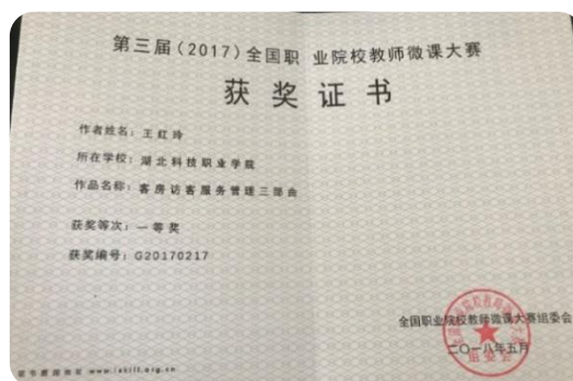
全国职业院校微课大赛一等奖