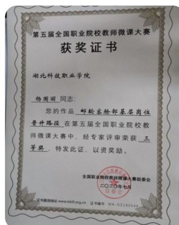
全国职业院校微课大赛三等奖