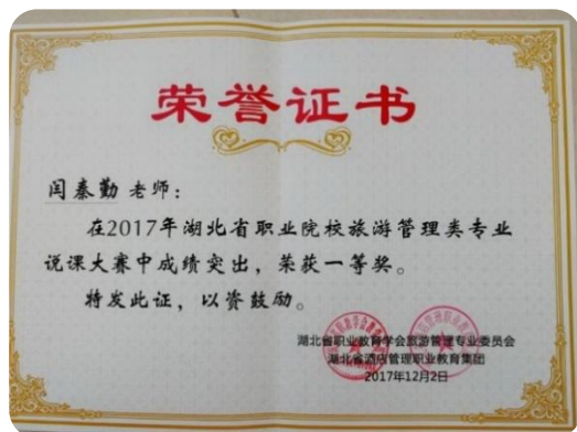
全省职业院校说课大赛一等奖