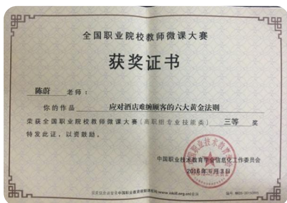
全国职业院校微课大赛三等奖