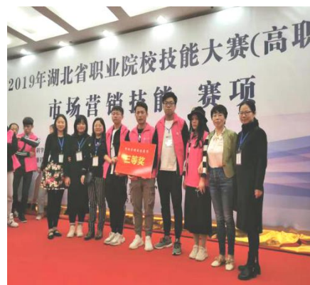
2019年省营销技能大赛赛后合影