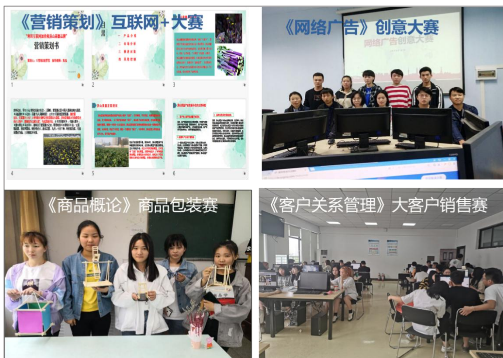
核心课程“教学练赛”四维一体课程改革

依托“店中校”校企多元实践主体合作培养模式，打造“会做生意、会带团队、会数据化经营”的新零售运营管理精英。“校、企、生”共同编制了契合市场需求、科学合理、定位准确的人才培养方案。开展核心课程“教、学、练、赛”四维一体课堂教学改革活动，以学生为主体的市场营销专业协会联手业界精英举办行业专业讲座、“毛遂自荐”营销大赛和市场营销技能大赛等系列精彩纷呈的课外活动，提升学生综合素质、选拔创新创业营销精英。为与永辉超市合作开设“1933 零售精英”订单班班、与植物医生合作开设“植优生”订单班，形成具有鲜明职业教育特色、集“产、教、学、做”一体的“店中校”校企合作模式，联手实施“四角色”（学生-学徒-合伙人-店长）订单班层递式人才培养，打造“智慧零售店长或精致生活店长”等复合型营销精英人才。