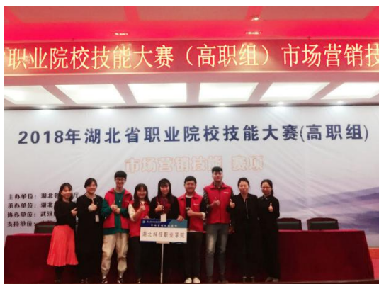
2018年湖北省首届营销技能大赛赛前合影