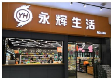
永辉超市“厂中店”-永辉生活馆