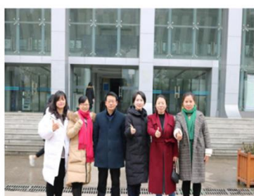
永辉超市校企双方洽谈后合影