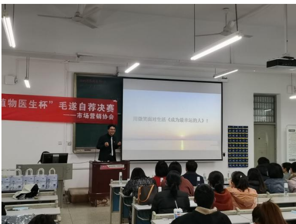
2020年植物医生杯毛遂自荐大赛决赛环节