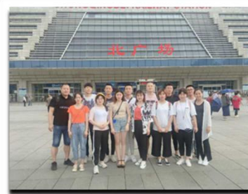
永辉超市订单班抵达重庆站北广场