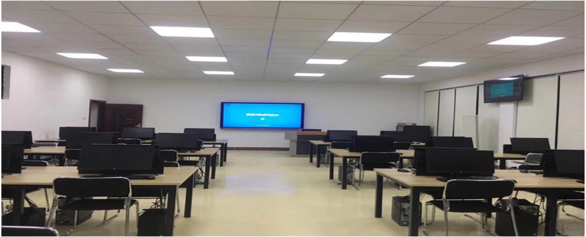
互联网营销实训基地精准营销实训室