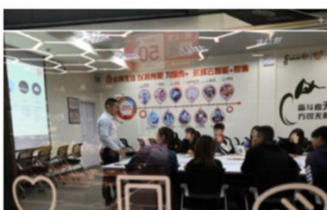
1933 零售精英实训基地生鲜类课程培训