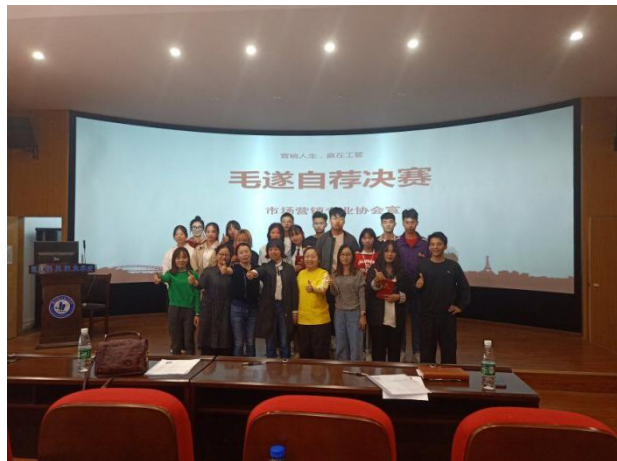
2019年毛遂自荐大赛决赛合影