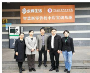
学院领导考察永辉超市“校中店”实训基地