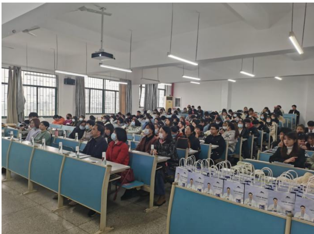
2020年植物医生杯毛遂自荐大赛决赛现场