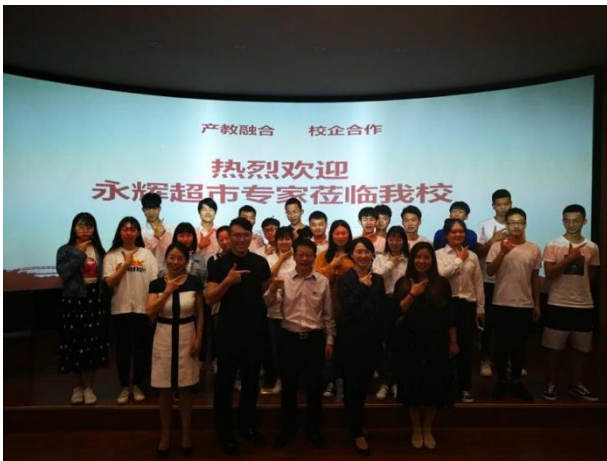
永超超市专家获邀举办新零售行业知识讲座