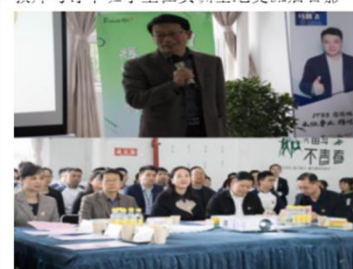
院领导参加 1933 零售精英培训并总结点评