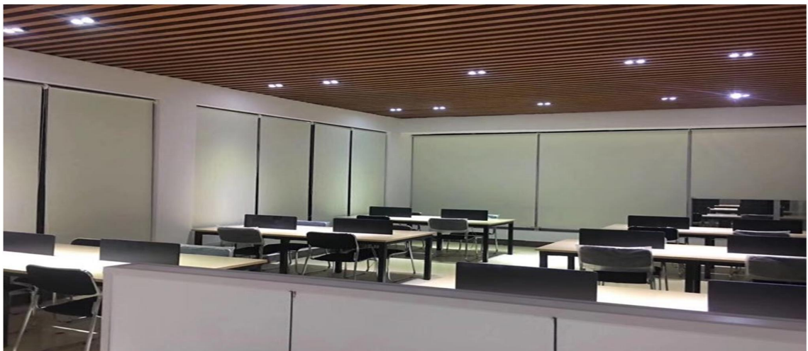
互联网营销实训基地创业实践实训室